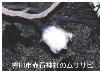
豊川市赤石神社のムササビ

9月4日のカフェでは、この地方に棲むタヌキ・キツネ・イノシシ・テンなど8種類の動物について皆さんと楽しく話し合いましたが、盛り上がったところで時間切れとなり予定の内容の半分で終わってしまいました。ご出席の皆様には、ご迷惑をおかけしました。その事情をカフェ事務局が察して下さり、印象の残っている間に後半をどうぞという有難いご配慮をいただき、『カメラがとらえた野生動物・その2』を開くことになりました。